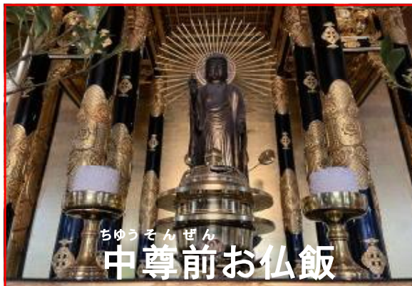
ちゆうそんぜん 中尊前お仏飯