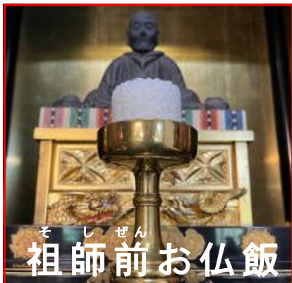
そしぜん 祖師前お仏飯