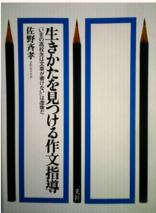
（「あとがき」より 一光社刊行）

私の生徒観も同様の思念に基づいている。私は生徒たち、子どもたちを、私との上下関係で見ることができない。知識の量においては、あるいは私の方に多少の優越があるとしても、それがどれほどのことであろう。私の国語教育研究の上では、生徒たちから私が学んだことの方が、はるかに多かったのである。